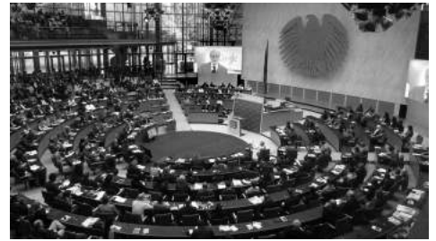
Global Media Forum 2014 arrancou esta segunda-feira (30/06/14) em Bona